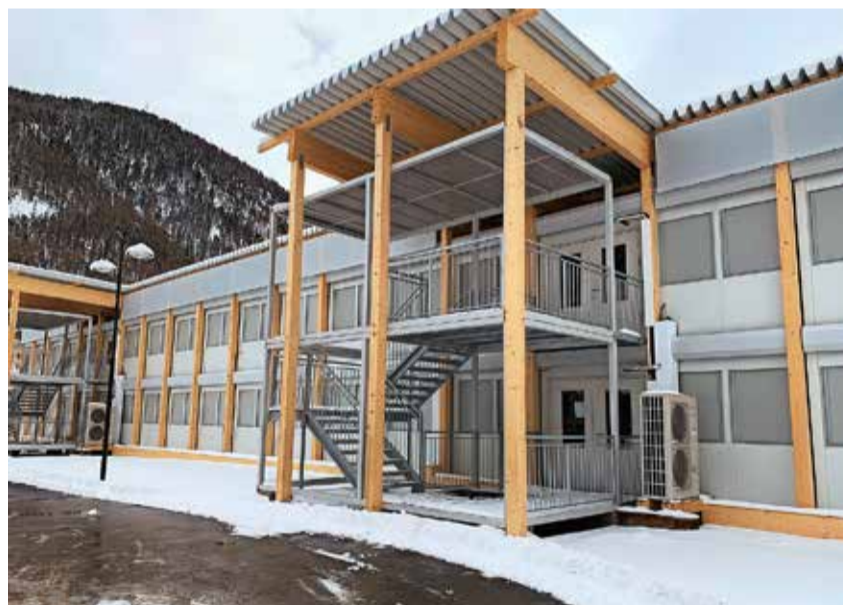
Schulhausprovisorium Obere Matten