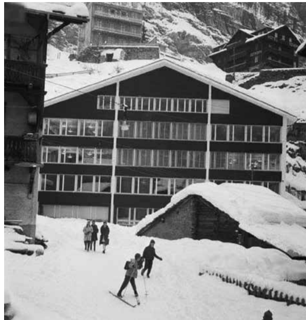
Schulhaus Walka 1959

«Bald fahren die Bagger auf – wir freuen uns auf das neue Schulhaus»