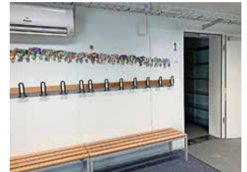
Garderoben im Schulhausprovisorium

Rund 250 Schülerinnen und Schüler bezogen 1959 das neu erbaute Schulhaus – der Unterricht dauerte acht Monate.